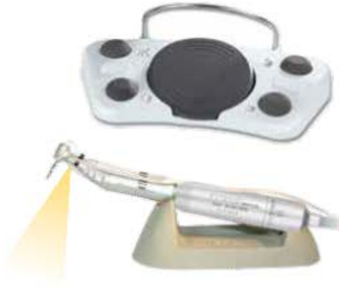
Pièce à main LED 20:1 Traus - CRB26LX